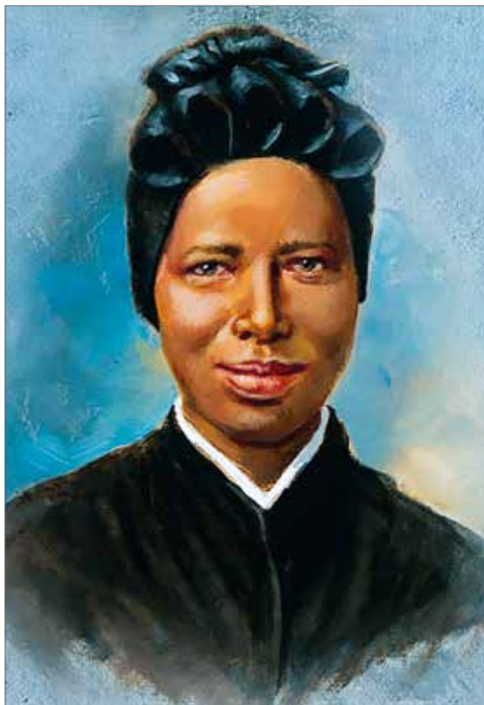
Santa Giuseppina Bakita, «umile figlia d'Africa» (GE n. 32).

capacità di gioia, poiché ci rende capaci di gioire del bene degli altri: “Rallegratevi con quelli che sono nella gioia” (Rm 12,15). “Ci ralleghiamo quando noi siamo deboli e voi siete forti” (2Cor 13,9). Invece, se “ci concentriamo soprattutto sulle nostre necessità, ci condanniamo a vivere con poca gioia” ( Amoris laetitia , n. 110)» (GE n. 128).