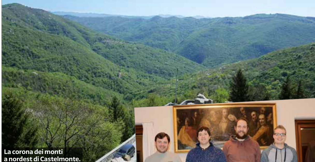
La corona dei monti a nordest di Castelmonte.