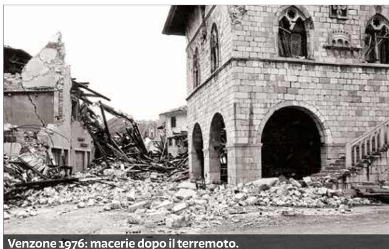
Venzone 1976: macerie dopo il terremoto.

ghi» nel 2017 dalla trasmissione Rai «Kilimangiaro», monumento nazionale. Appena 300 abitanti