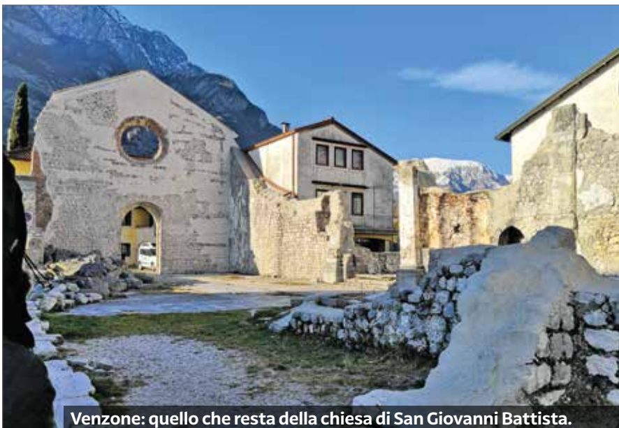
Venzone: quello che resta della chiesa di San Giovanni Battista.

Nota finale: parte del territorio comunale di Venzone è compreso nel Parco naturale delle Prealpi Giulie. Appena fuori della cittadina è possibile esplorarne i sentieri o passeggiare lungo l'antica via celtica, che collega le quattrocentesche chiese votive che contornano il paese. ●