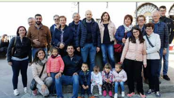
14.10.2018: 23 pellegrini del gruppo «Amici di Campolongo» di Conegliano (TV).