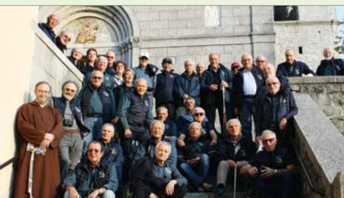
19.10.2018: alcuni pellegrini del «Gruppo storico la Grande Guerra» di Mestre-Venezia.

3.11.2018: ► 3 pellegrini da Pagnacco (UD) venuti a piedi: partiti alle 4.30 e arrivati alle 11.30.