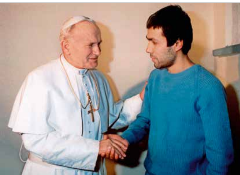
Carcere romano di Rebibbia, 27.12.1983: il santo papa Giovanni Paolo II incontra il suo attentatore, Mehmet Ali Agca, e lo perdona.

Di fatto, non possiamo non essere preoccupati per l'esaltazione di un individualismo egoista che esclude ed emargina ogni diversità e che, attraverso slogan urlati e ripetuti con esasperante monotonia, crea esclusione,